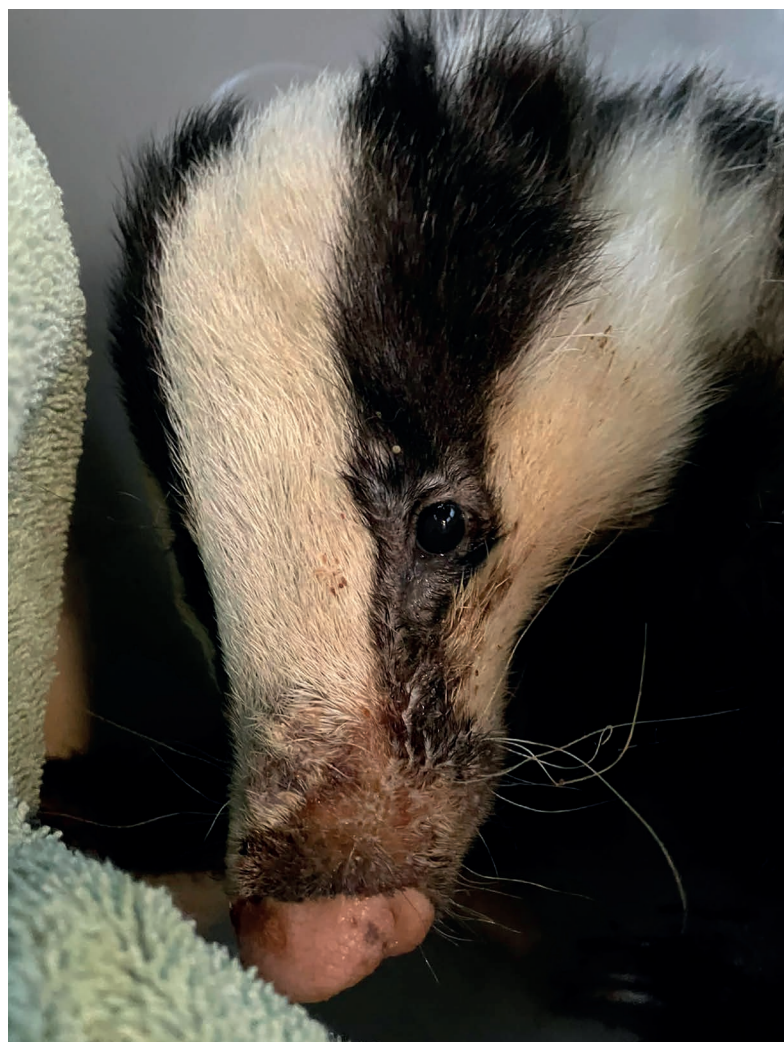
DORNRÖSCHEN genießt mittlerweile ihre Vollpension.