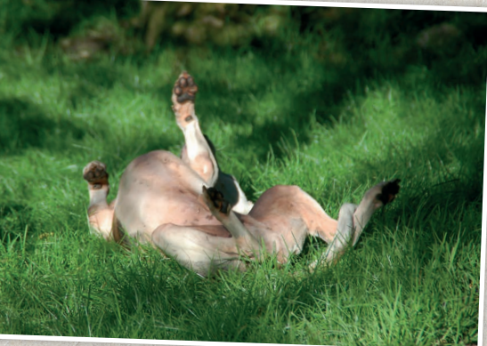
HOBBIT genießt sein Dasein in vollen Zügen.