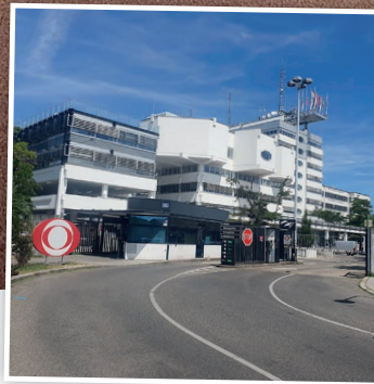
ORF-Studioaufnahme in Wien.