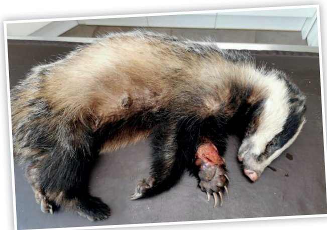
DORNRÖSCHEN schwer verletzt in tierärztlicher Behandlung.