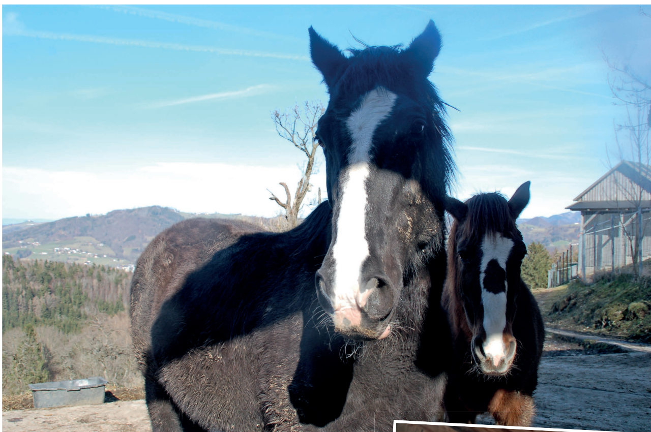
WINSOME & RONCALLI waren ein Herz und eine Seele.