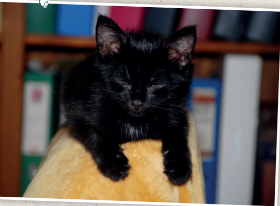
UEFA: Das Schwänzchen musste amputiert werden.