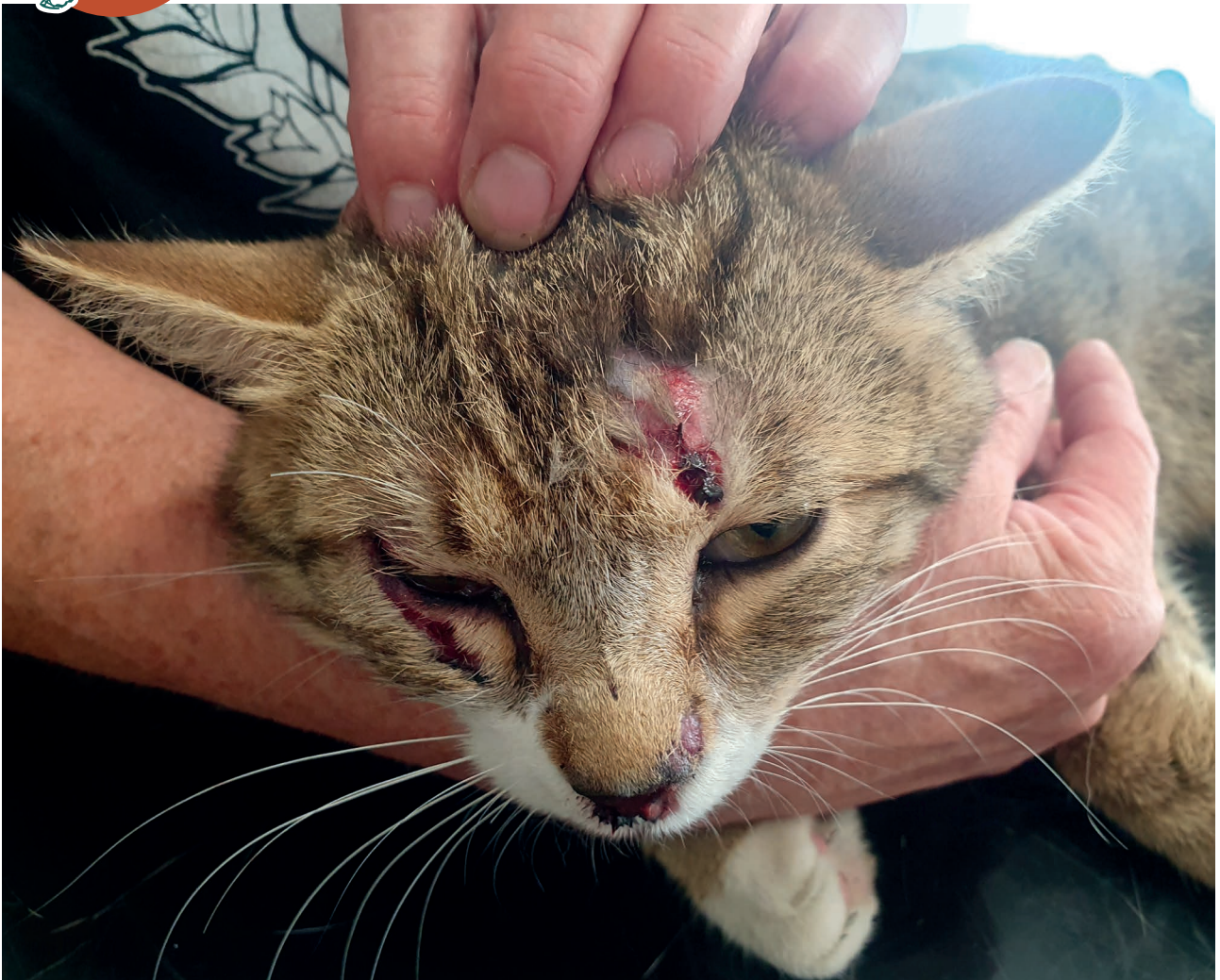
Die schwer verletzte Katze war an diesem Tag nicht das einzige Opfer.