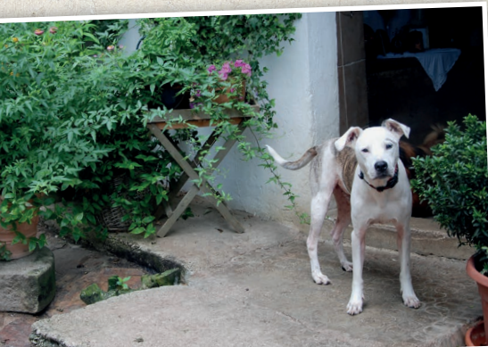
HOBBIT, der von der BH Braunau abgenommene Hund.