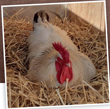
♪ Macho, Macho ...